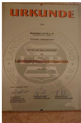
Urkunde des LandesSportBundes Sachsen-Anhalt.