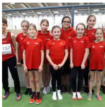
Mannschaft SLV U12