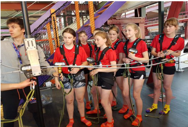
Anstellen zum Klettern