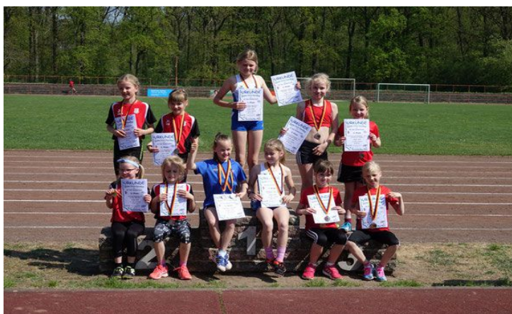
3. Platz SLV