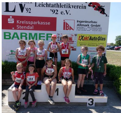
Siegerehrung Staffel w8

Es ist nicht überliefert, aber man kann davon ausgehen, dass Kampfrichter, Übungsleiter und alle fleißigen Helfer am Sonntag nach diesem schönen aber eben auch anstrengenden Wochenende schnell und tief in den Schlaf gekommen sind. Euch ALLEN auch Herzlichen Dank für diesen Einsatz.