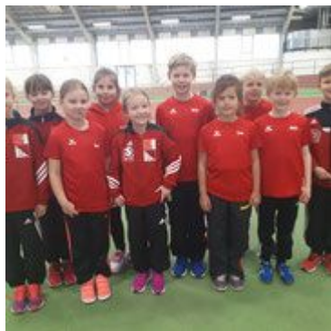
Mannschaft SLV U10

Aber auch alle Nichtgenannten trugen zu vielen persönlichen Bestleistungen bei. Herzlichen Glückwunsch an die jungen Athleten und Athletinnen und einen großen Dank wieder einmal an alle unsere Eltern und Großeltern, die uns vor Ort stets unterstützen.