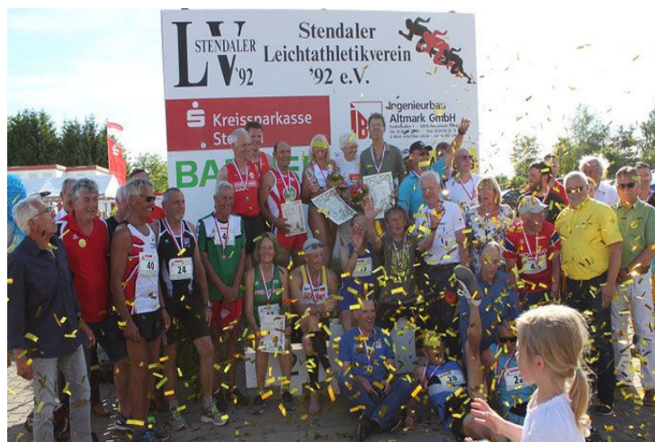
(links) Siegerehrung–Siebenkampf – Siegerehrung-Zehnkampf;