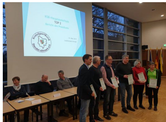
Vertreter der 6 berufenen Vereine