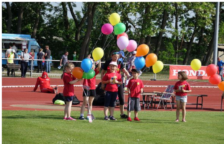
Zur Eröffnung wurden Luftballons mit den teilnehmenden Länderfahnen in den Himmel geschickt