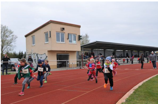
Unsere Kleinen AK 4-6

Trotz kaltem schlechtem Wetter und einem kurzen Schneeregen kamen ca. 200 Teilnehmer am Läuferntag ins Stadion, um ihre Leistungen zu beweisen. Besonders schwierige Bedingungen hatten unsere Kampfrichter, die bei diesem kalten Wetter voll ausgekühlt waren.