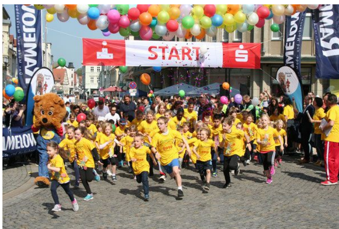
Start des Sandmännchenlauf

asz. 28 Kinder der TG Kordts/Szymanski waren beim Sandmännchenlauf mit dabei. Ebenfalls startete bei den Staffeln eine Mannschaft des SLV's und belegte den 2. Platz.