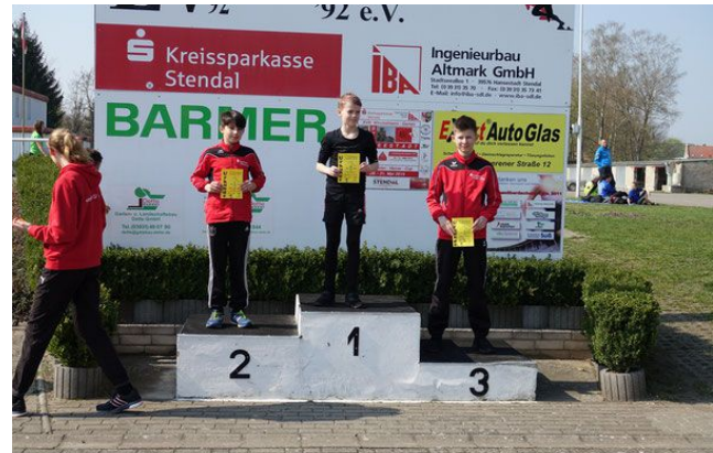
1. Platz Louis Adomeit