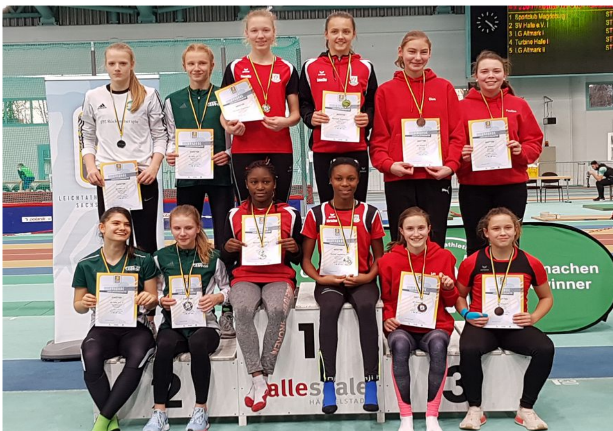
3. Platz LG Altmark