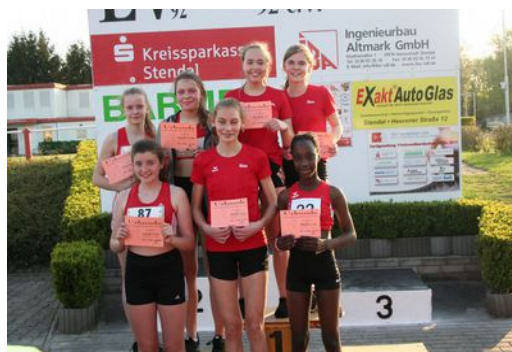
W 14 bei der Siegerehrung