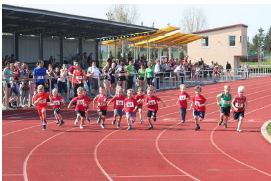
M5 beim Start

wJU16 - Schwedenstaffel – LG Altmark – 2:38,51 min