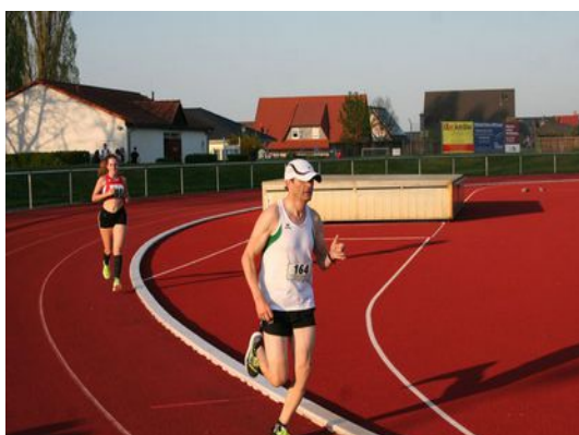
Die 5000 m-Läufer