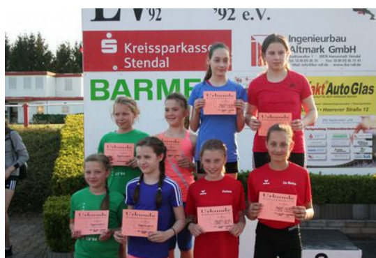
W15 bei der Siegerehrung