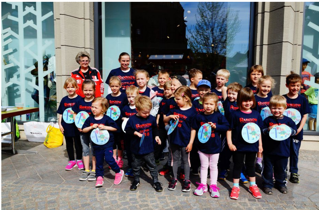
Hier einige Kinder der TG Szymanski beim Ramelow-Lauf (es waren einige mehr)