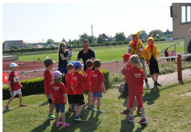
Unsere Kleinen und die Zwerge