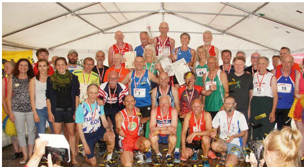
Siegerehrung der Zehn-Kämpfer/-in