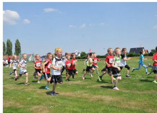
Start Crosslauf M 4-7