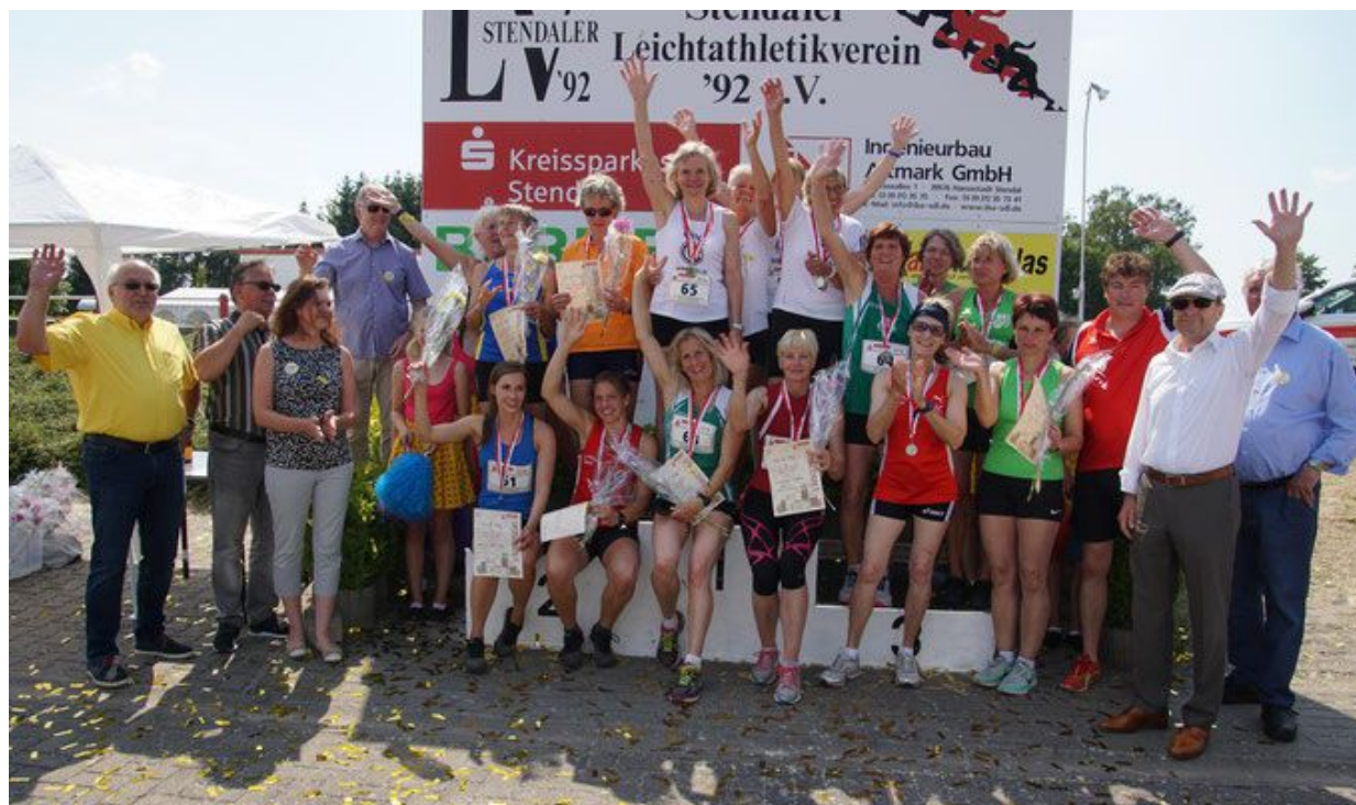
Siegerehrung der Sieben-Kämpferinnen