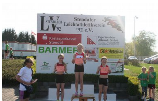
W10 bei der Siegerehrung