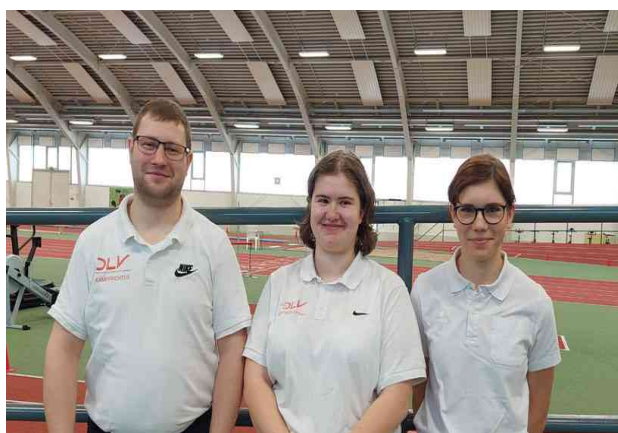
Ein großes Dankeschön für die Unterstützung vor Ort an unsere Kampfrichter!!!