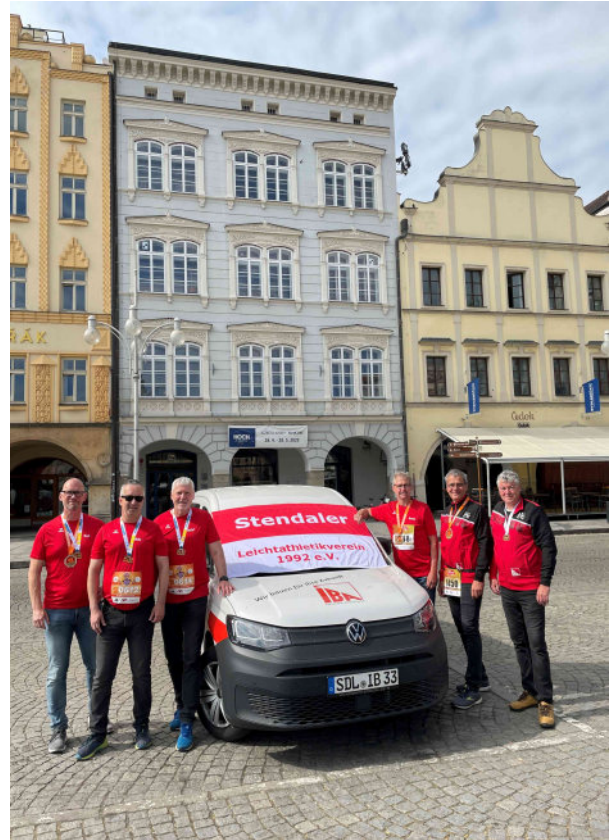
Bild: Parken auf dem Marktplatz in BUDĚJOVICE