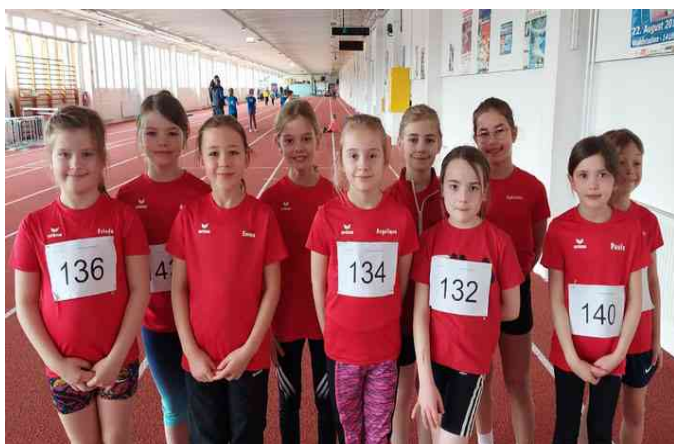
Bild: Mannschaft des SLV'92 U10